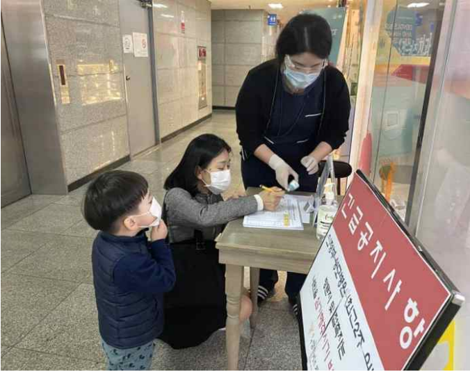
(출입구) 체온 측정, 방명록 작성, 안내문 비치