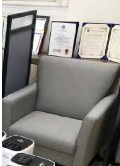
(안심대기실) 의자간 간격 띄우기와 칸막이 설치